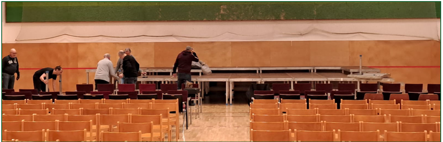
Vor dem Konzert und nach dem Konzert: Die fleißigen Hände der Sänger