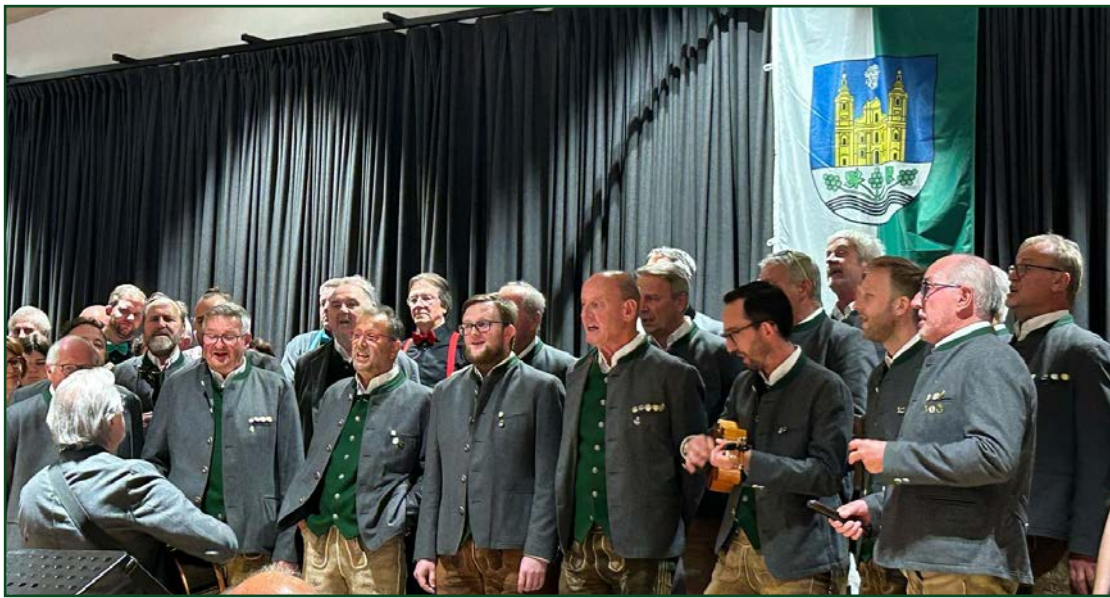
Der MGV beim Regional-singen in St. Nikolai/Dr.

Gemeinsam mit neun weiteren Chören sorgte der MGV für beste Unterhaltung in der ausverkauften ZIB - Halle.